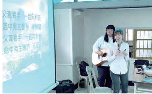
▲兩位講者帶動大家唱聖歌敬拜讚美 ◀東部青年在信仰講座後歡喜大合照