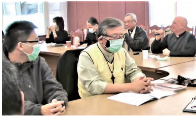
▲不畏新冠疫情緊繃，全國福傳大會三籌會議如期召開，各教區、修會及教友代表踴躍出席，集思廣益並提出寶貴意見。

每個教區應看重福傳大會的第2個階段，因為是每個教區重要的目標，也是未來評估的標準；為此