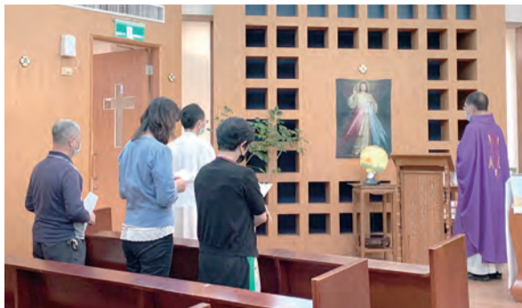
▲台中教區主教公署同仁同心合意獻彌撒祈禱

自四旬期第一主日起，於主教座堂提供線上彌撒直播，包括：國語、台語、英文等服務，讓因為居家隔離、身體不適、長期患病等無法前往教堂的教友，可選擇觀看彌撒直播和神領聖體，替代上教堂參加彌撒的本分。同時，也錄製了不同語言及手語版防疫短片，提醒大家注意身體的健康，配合政府的防疫措施，藉由祈