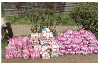
▲登山遊客及朝聖者在一天的假期內，揹上聖母山莊的小包裝瓷磚與地磚，令人深深感動。 ▲位於抹茶山麓的聖母山莊，在周末假日或連假期間總是人潮滿滿。