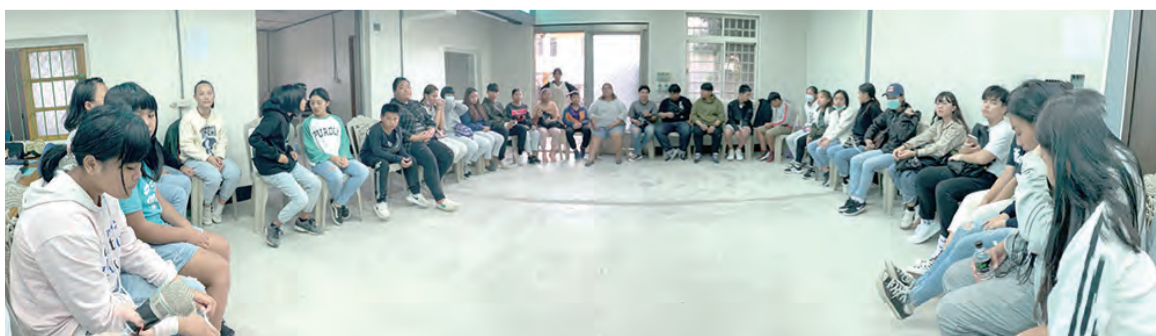
▲在課程之後，大組分享心中的觸動，讓我們聆聽青年的心聲。