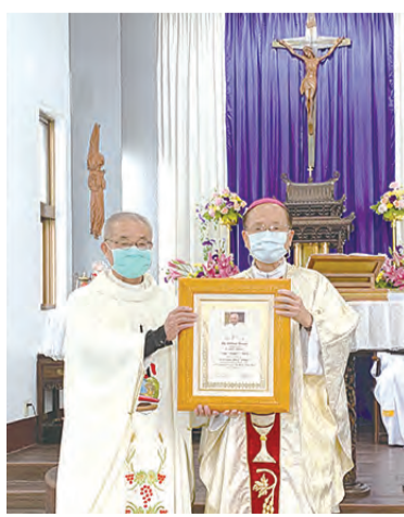
▲蘇耀文主教（右）致贈教宗方濟各降福狀，給壽星鄭文宏蒙席。