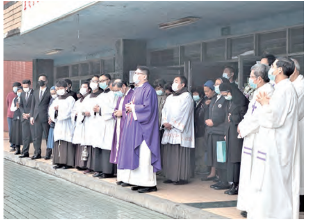
▲全體恭念〈天主經〉、〈聖母經〉及〈聖三光榮頌〉恭送靈車啟程赴聖山安葬。