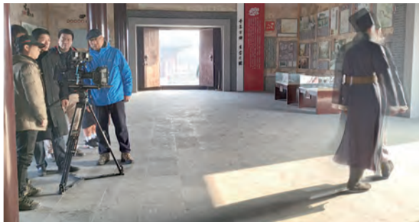
▲劇組團隊正在拍攝利瑪竇抵達北京，終於盼來中國皇帝召見的一幕。

徐光啟（1562-1633）是南直隸松江府上海縣人，他最著名的事跡之一就是與耶穌會士利瑪