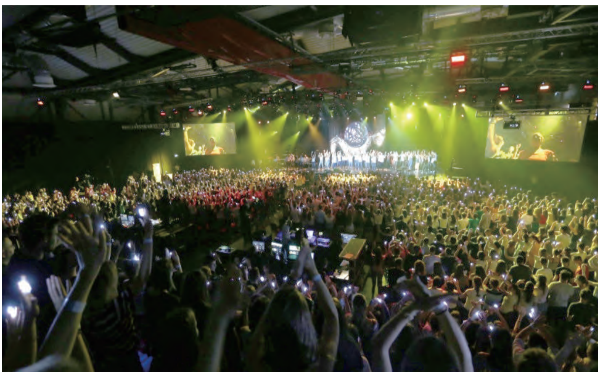
▲青年們熱烈響應第52屆國際聖體大會委員會所舉辦的「起來！奉獻一天給耶穌」祈禱活動。。

近年來，飽受歷史風暴之苦的中歐各國人民，經常在戰場上相互對峙。儘管如此，他們卻從未忘記那將他們深深聯繫在一起的基督信