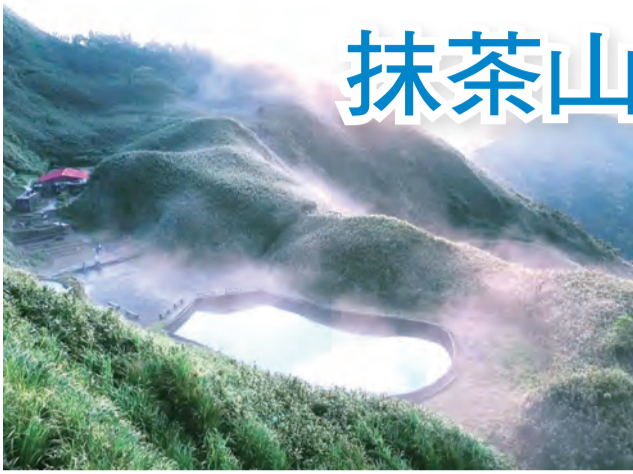
▲聖母山莊美景天成，歡迎教友們上山朝聖。

宜蘭礁溪海拔884公尺高的聖母山莊，不僅有聖母顯靈救人的事蹟流傳，更孕育了怡養精神的美景，抹茶冰淇淋山及愛好山林人的心。