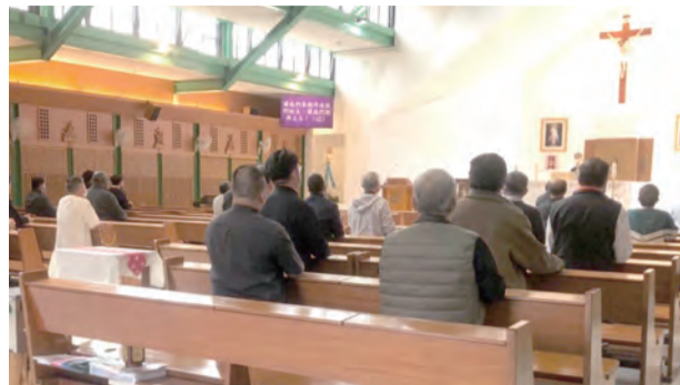
▲台中教區神父們在月退省時，為疫情早日平息而齊心祈禱。