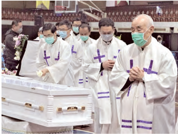
▲共祭神長們瞻仰米光華神父遺容，追念深深。