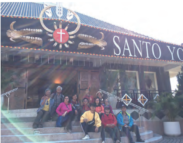
▲台東金崙聖若瑟天主堂

已有60年歷史的知本天主堂，由原本的茅草屋改建，1956年，費道宏神父抵達台東，與山道明神父一同記錄了卑南族石生系統，口傳歷史與祭儀文化，讓沒有文字的卑南文化得以保存下來，一生都奉獻給卑南族。（參見曾建次主