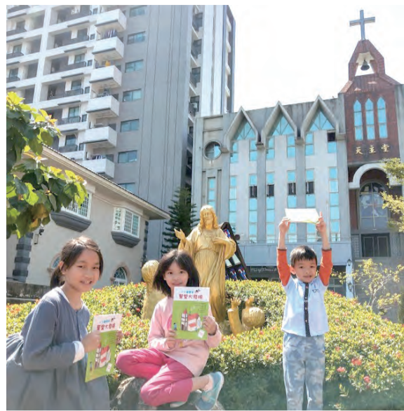
▲我們都是熱愛聖堂的小小觀察家。 ◀孩子們迫不及待地拿著書去對照聖堂的擺設。

境；遣詞用字也很簡單扼要，不是教條式的描述，而是以平實易懂的口吻，讓孩子理解聖堂各個布置的精神與用意。最令人驚訝的是，這本書還提到「手機」！沒錯，手機是我們聯絡、查資料的好工具，但如果在彌撒時拿出手機，反而會阻礙我們和天主溝通唷！