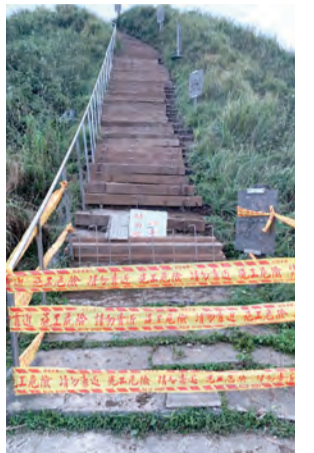
▲聖母山莊苦路步道已經修復，我們在四旬期拜苦路時，格外感激購料、搬運及維修階梯的愛心人。

山友團體共同出資出力，在林務局監督下，期望將聖母登山步道建構成為全國模範初級登山步道，並促使聖母山莊觀景平台之自然景觀揚名國際。