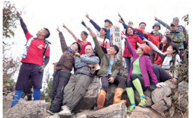
▲在鳶嘴山的三角點，手指高舉，將榮耀全歸於天主！

抽筋的肌肉，又有隊友幫我噴上運動消炎劑，瞬出一團溫暖駐留心頭！內心祈求主護祐我平安一步步往前，終於沒有再抽筋，最後一名抵達標高2180公尺的鳶嘴山。