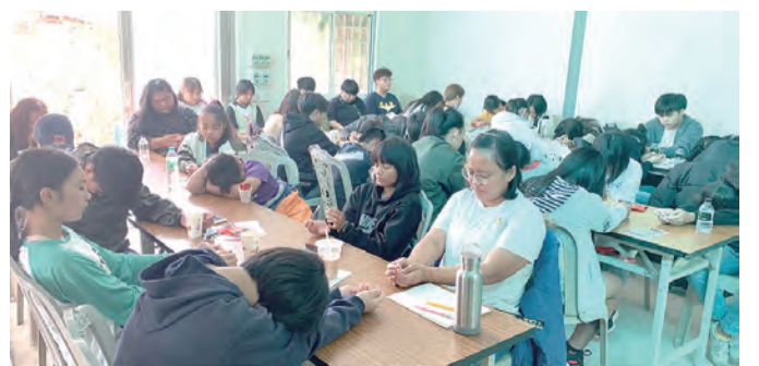
▲反省祈禱與和好聖事，讓大家獲得被寬恕的喜悅。