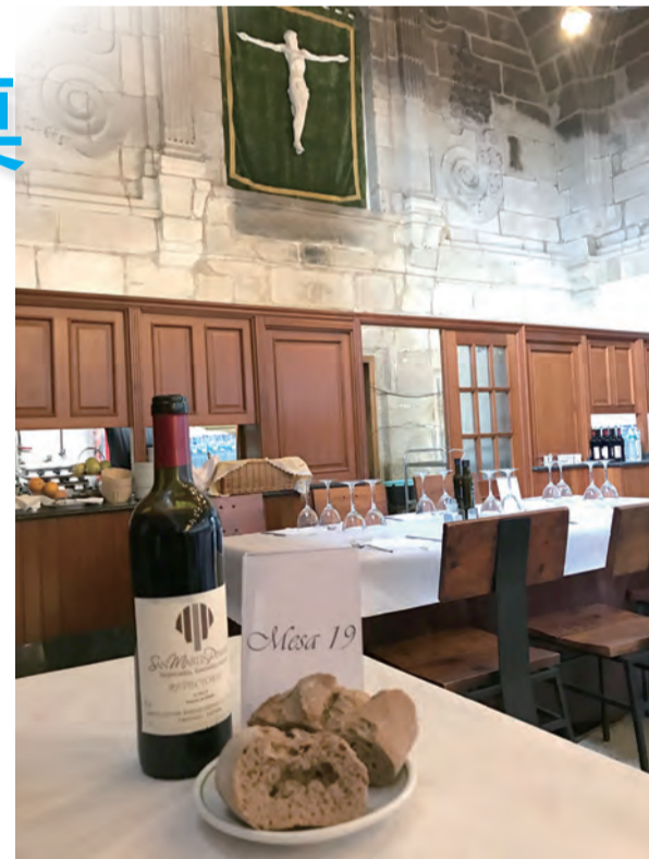
▲Camino的19號餐桌，讓我在這充滿不確定的朝聖途中，是如此確定耶穌給的愛。