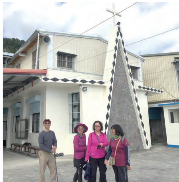
▲雖然走了一連串苦路陸坡才抵達台東的多良天主堂，但寬闊的太平洋映入眼前，心被打開了！