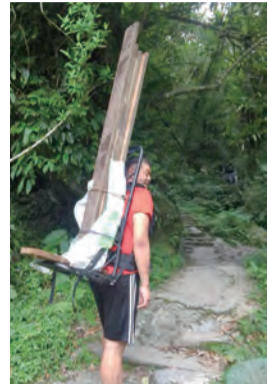
▲一次揹著4片重達20公斤實木板的山友，仍然面帶笑容，真的令人心好感動。