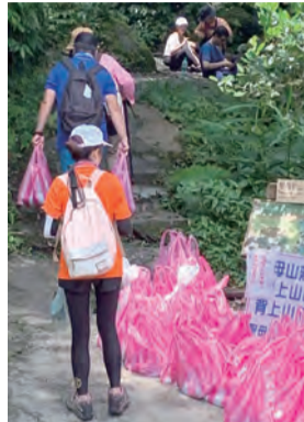
▲遊客不怕負重的辛苦，從通天橋就自動自發地順道攜帶放在路口的水泥和砂石等物料上山。