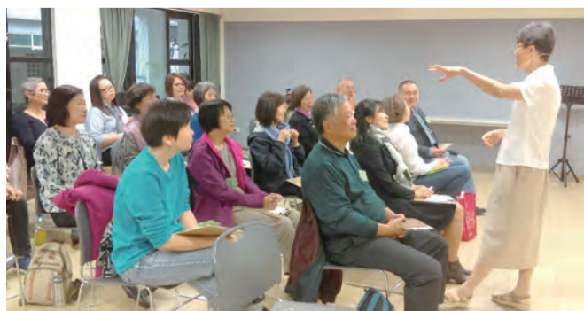
▲修女帶領充實生動的學習 ▶豐富溫柔的互動，更易心領神會。